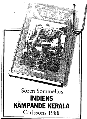
Sören Sommelius INDIENS KÄMPANDE KERALA Carlssons 1988