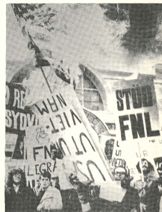
Kanske trodde många en gång att revolutionen skulle börja i "tredje världen". Vänstern måste därför avhålla sig från att kritisera befrielseströrelserna.

listiskt inriktade länder och rörelser började bekämpa varandra – så splittrades vänstern.