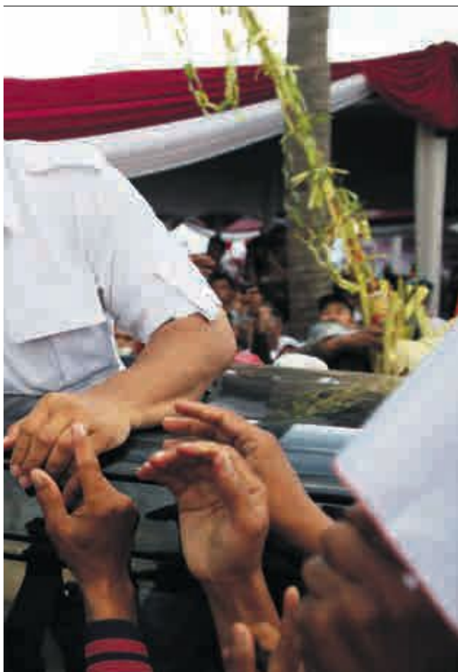
i Indonesia. Han bygger makten sin på korrupsjon, skriver Olle Törnquist.