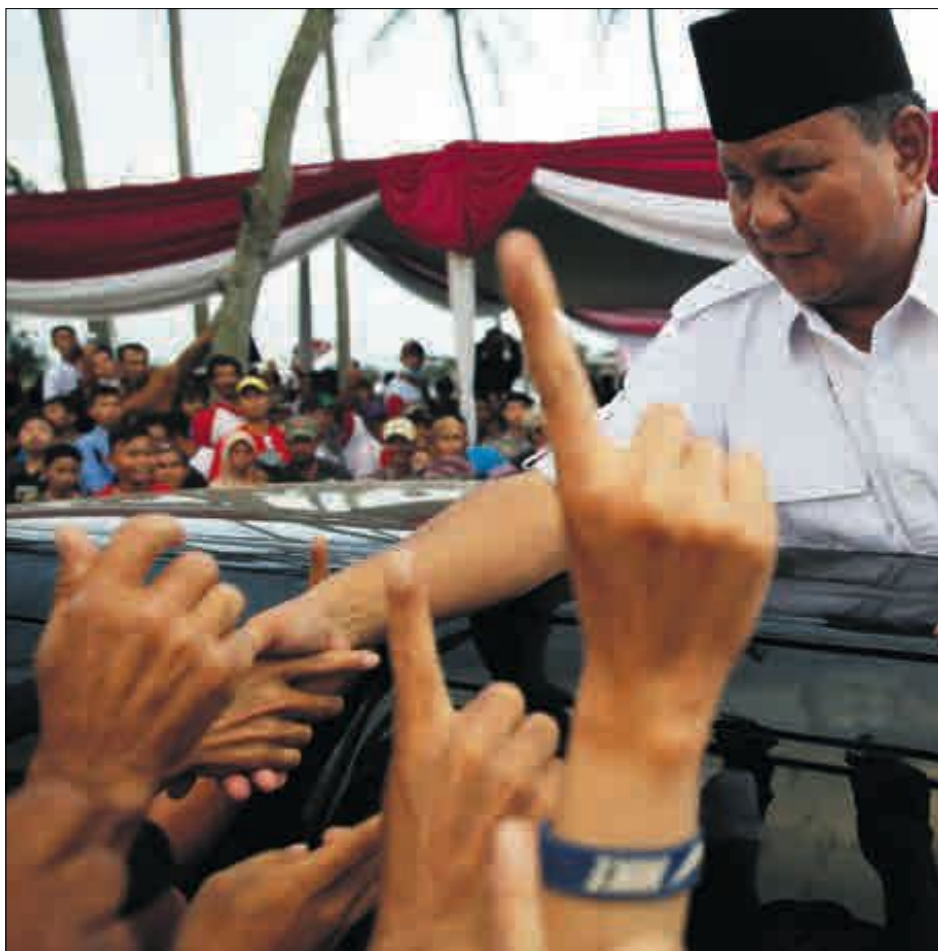
«DEN STERKE MANN»: Eksgeneral og forretningsmann Prabowo Subianto er en av kandidatene i presidentvalget

Dette er vanskelige nasjonalt. Der finnes ikke de organisasjonene og progressive aktørene Jokowi kunne forhandle med lokalt. Selvsagt bidrar for eksempel antikorrupsjonbevegelsen og alliansene for menneskerettigheter og sosiale rettigheter.