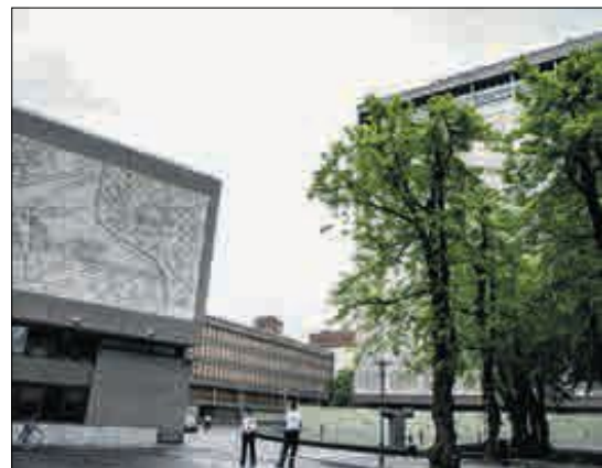
BØR BRUKES: Regjeringa har gått inn for at Y-blokka (til venstre) rives.