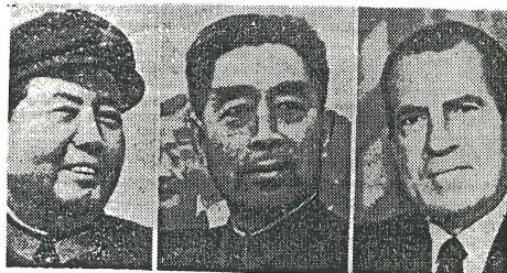
Med Chou En-lai i centrum ses troligen Mao och Nixon 1972.

HÄRTILL KAN läggas att en undersökning — Revolution and Chinese Foreign Policy — av Peter van Ness (anmäld i DN 26/3-71) klart visar att Kinas stöd till befrielse rörelser dels bekräftar av dessas ställning visavt Kina, Sovjet samt USA, dels av kampens närhet till Kina samt slutligen av hur Peking bedömer rörelsens möjligheter att segra. Denna undersökning berör primärt tiden före kulturrevolutionen men är enligt densamma även giltig för tiden omedelbart efteråt.