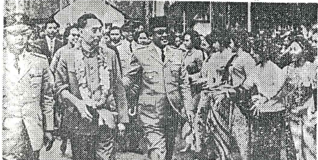
Chou En-lai och Sukarno 1965, då Kina ännu hoppades kunna skapa ett anti-imperialistiskt FN.

SLUTSATSEN av detta resonemang blir att Kina inte längre har den möjlighet Indonesien en gång erbjöd: att vinna de s. k. anti-imperialistiska ländernas förtroende, samt att parallellt med, och i direkt opposition emot FN kunna föra dessas kamp. Kina har valt att — eller tvingats att — lämna sin mer eller mindre isolationistiska position och att agera via etablerade kanaler, som statschefer — oavsett vilken klass de representerar — och Förenta Nationerna. Kinas grundläggande politik har — om vårt resonemang är riktigt — ej ändrats. Det är endast förutsättningarna att driva politiken som skiftat, och det uppseendeväckande verktyget som smitts om.