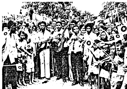
Massmöte för FRETILIN i Laleira, hösten 1975

Viktiga instrument i det här arbetet var FRETILIN: s egen politiska organisation, som enligt frontens egna uppgifter rymde ca 200 000 registrerade medlemmar, en kvinnoorganisation, flera fackliga organisationer samt en studentrörelse.