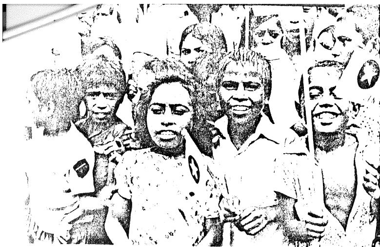
Barn välkomnar FRETILIN i Laleira, hösten 1975

uppbyggnaden gick långsamt. Öst-Timor eftersattes. Kolonin gav inte längre några inkomster att tala om till moderlandet och var den mest underutvecklade av Portugals alla kolonier. Den tidigare beskrivna underutvecklingen konserverades. De få investeringar som kom till stånd, t.ex byggnandet av en hamn i huvudstaden Dili, gynnade främst de portugisiska plantageägarna och de kinesiska affärsmännen, som hade i det närmaste monopol på handeln. Som tidigare nämnts finns det dock planer på vissa japanska investeringar och intresset för oljeprospektering ökade.