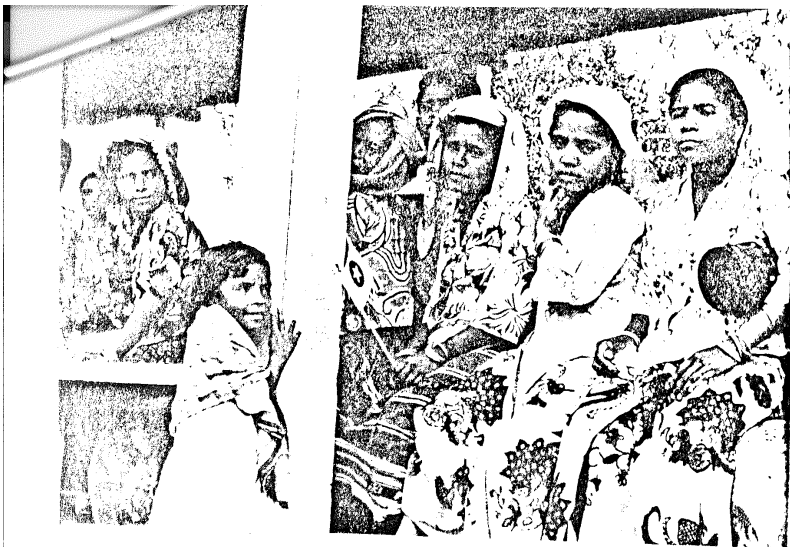
På marknaden i Ainaro, hösten 1975

bergen ofta ända ut till kusten medan man på sydsidan finner en hel del sumpmarker.