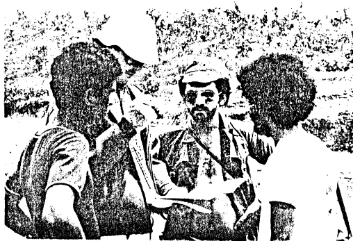
Australisk journalist i samtal med FRETILIN ledare i Aleu, hösten 1975. Tredje fr v är José Ramos Horta.

Morden förstärkte den australiensiska opinionen mot den indonesiska aggressionen. Även inom det regerande arbetarpartiet började FRETILIN och Öst-Timors sak ses med blidare ögon.