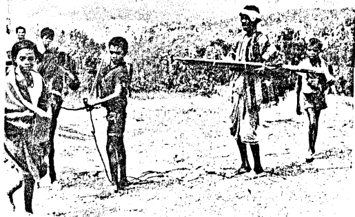
På vandring i bergen med FRETILIN nära Aileu, hösten 1975

Öst-Timors utveckling har hämmats, underutvecklats, under 450 års kolonialism. Folket är fattigt medan jorden är bördig och råvarutillgångarna stora.