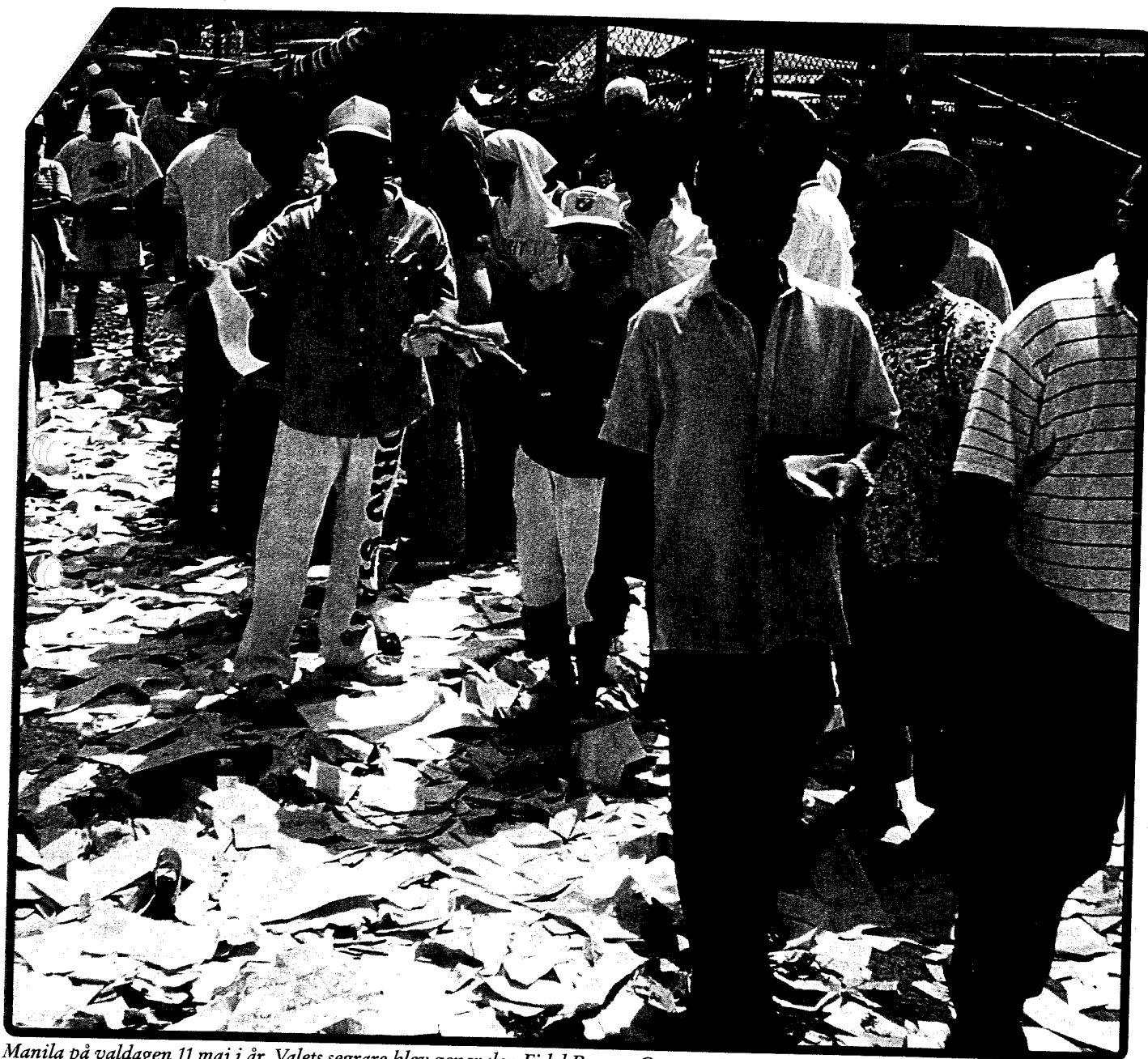
Manila på valdagen 11 maj i år. Valets segrare blev generalen Fidel Ramos, Corazon Aquinos starke man.

Vände då istället? Blev sakfrågor avgörande? Satsade folk på hederliga politiker som företrädde deras idéer och intressen? Ingalunda! I presidentvalet segrade istället en general, Fidel Ramos, som var chef för Marcos polisstyrkor, tills han övergav det sjunkande skeppet, hoppade över till Corazon Aquinos istället och nu marknadsfördes som hennes "starke man". Därefter kom Miriam Defensor-Santiago – en korsning mellan Bert Karlsson och Maggie Thatcher som bars fram av massmedia med ett närmast infantilt budskap om att allt ont beror på korruptionen och att den kan bekämpas genom att politiker spärras in med inlöften nästan lika många Eduardo Cojuangco, den stenrike affärsman som stod närmast Marcos. Men nu vann alltså